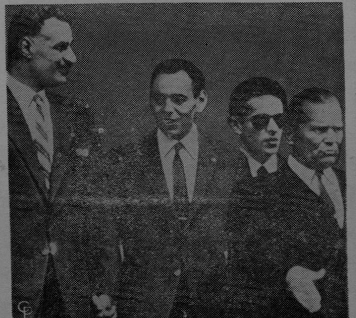
LIDERES NEUTRALISTAS CONDANAN A RUSIA. — El Presidente de la República Unida Árabe, Gamal Abdel Nasser (izquierda) abandona el lugar donde se viene celebrando la conferencia de los países neutrales en Belgrado, acompañado por el rey Hassan de Marruecos, y del anfitrión, el presidente de Yugoslavia, Tito (derecha). Nasser condenó que Rusia iniciara las pruebas de proyectiles nucleares y pidió que se convocara una conferencia de las grandes potencias para