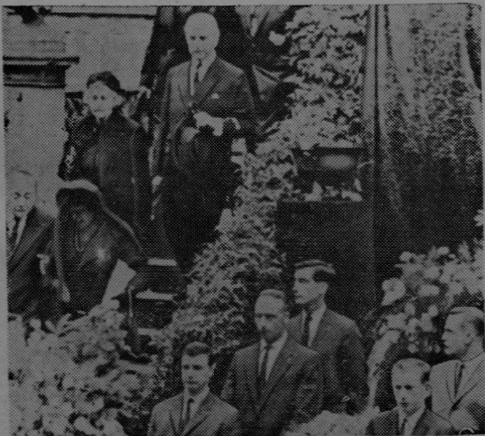
ULTIMO TRIBUTO PARA CORREDOR DE AUTOS.— Impresionante resultó el entierro del conductor de autos de carreras Wolfgang von Trips, quien murió en uno de los accidentes ocurridos durante las carreras del Grand Prix celebradas en Italia. El entierro tuvo lugar en Hemmersbach, Alemania. Entre los que asistieron al entierro figuran en la extrema izquierda los padres del malogrado conductor y a la derecha Phil Hills, quien fue el ganador de la fatídica carrera. En el accidente murieron unas 14 personas que participaban en el evento.